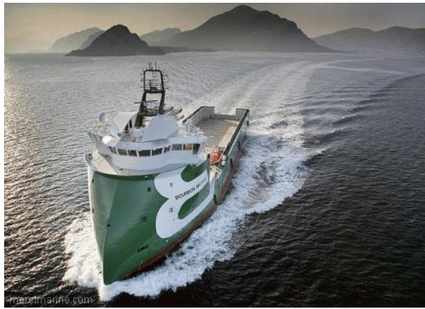
Le Bourbon Mistral, l'un des premiers navires modernes à étrave inversée