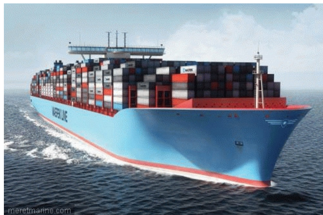
Le premier navire de 18 000 EVP sera livré en 2012

D'un point de vue architectural, il conviendra de voir si le concept de double coque, imposé au début des années 2000 pour limiter les risques de marée noire, doit être pérennisé car, après une décennie d'exploitation, de nombreux experts craignent que cette option provoque de graves problèmes de corrosion. Toujours en matière de lutte contre la pollution, le navire du futur intègrera sans nul doute des dispositifs permettant de mieux sécuriser les cargaisons et les soutes à combustible. Ainsi, des équipements de type Fast Oil Recovery System (FORS) permettent depuis peu de mieux accéder aux soutes pour pomper le carburant en cas d'accident.