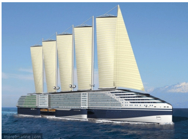
Le concept de paquebot vert Eoseas

propulsion au gaz naturel liquéfié offre de nouvelles perspectives. Dans le même temps, les bureaux d'études planchent sur les designs, avec des formes de carènes optimisées, permettant aux navires de mieux franchir les vagues, améliorant ainsi le confort, tout en réduisant les efforts sur la structure et la consommation en carburant. L'exemple le plus symbolique dans ce domaine demeure l'étrave inversée, qui a réalisé avec succès ses premiers pas dans l'offshore et pourrait bien percer dans d'autres secteurs. On notera aussi l'adoption de nouveaux revêtements, comme les peintures à base de silicone, ou encore la lubrification de la coque par injection de bulles d'air.