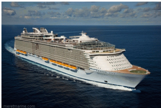
L'Allure of the Seas peut transporter plus de 8 000 personnes

De nombreuses questions se posent également devant l'augmentation considérable de la taille des navires. Cette tendance se traduit par la mise en service de géants, avec des porte-conteneurs qui embarqueront bientôt près de 20 000 boîtes et des paquebots capables de transporter plus de 8 000 passagers et membres d'équipage. Ce gigantisme impose de repenser la sécurité à bord de ces bateaux, face auxquels les moyens de secours sont aujourd'hui insuffisants, mais aussi de réfléchir, pour les navires de commerce, au contrôle des marchandises transportées.