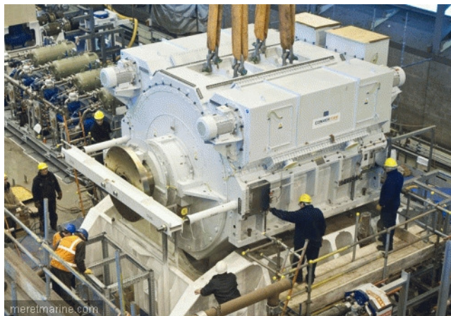
Moteur de propulsion

Des bateaux plus sûrs, plus performants et plus respectueux de l'environnement. C'est la voie suivie aujourd'hui par les compagnies maritimes, les chantiers navals et leurs équipementiers. Des enjeux qui seront au coeur des réflexions menées au cours du prochain forum sur la prévention des risques maritimes et portuaires MARISK, qui se déroulera à Nantes fin janvier. Si des designs très novateurs ont émergé ces dernières années, il ne faut probablement pas s'attendre, sauf surprise, à de grandes ruptures technologiques à court et moyen termes. Très règlementé et pragmatique, le secteur maritime se modernise en fait par étapes, intégrant progressivement différentes avancées technologiques, lorsque celles-ci sont matures et éprouvées.