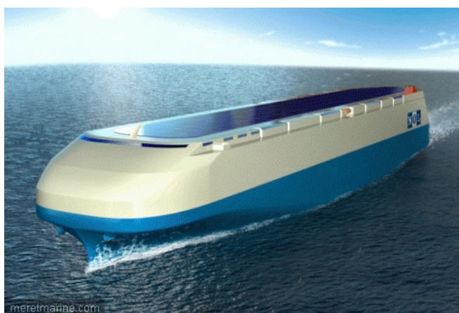
Concept de roulier vert